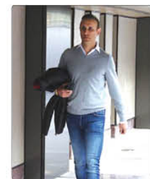
سرمدی پرسپولیس با اشاره به مشکلات مالی فراوان پرسپولیس درباره تصمیم احتمالی سازمان لیگ مینی بر نیمه کاره ماندن بازیها گفت: چیزی مهم تر از سلامتی مردم نیست. ایستادگی کسی ضرر ندارد.