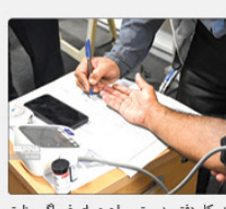
مدیرکل دفتر مدیریت بیماری‌های غیروابگیر وزارت

یافته‌ها اعلام کرد: از ۲۰ تا ۲۵ میلیون شهید مشارکت در پوشش ملی سلامت و ۲۵ درصدی زنان در کشور در پوشش ملی سلامت شرکت کردند.