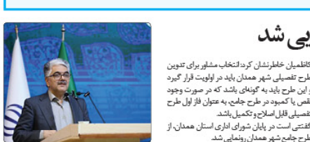
سخنرانی در نشست علمی در مورد تغییرات اقلیمی و مدیریت منابع.

تغییرات اقلیمی و مدیریت منابع، تهدیدی جهانی در سایه تغییرات اقلیمی و مدیریت منابع است.