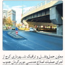
معاون حمل‌ونقل و ترافیک شهرداری کرج از اجرای عملیات اصلاح هندسی نوربزرگان جنوب