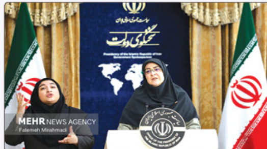
نی‌تود و این موضوع را به هیچ عنوان انکار نمی‌کنیم.

فروردین یازگشایی دانشگاه‌ها مهرجاری در لایحه به موضوع دانشگاه و دانشجویان اشاره کرد و افزود: دستمزد فعال و چولی است که حق اعتراضی دارد اما همه ما باید خطر فرارزمارت را می‌توانیم در زمان صیقلیت نباید از آن مدول کنیم. وی با بیان اینکه مسر درست گفتگوی مؤثر و عقلانیت است که خشم و پرخاش افروزد جا دارد از وزری محترم علوم و بهداشت، همچنین روسای دانشگاه‌های هیات علمی و کادر دانشگاه‌ها که با سیوری به مسر یازگشایی دانشگاه‌ها کمک می‌کنند تشکر کنیم. می‌دانیم که مسر فرهیختگی قسنتی با تحمل و مدارا و قسنتی دیگر با دقایی است. همه ما باید هوشیار باشیم و می‌دانیم که قشر دانشجوی هم هوشیار است.