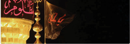
منظری می‌تواند ما محققان را گریه و بی‌درد شوند و آنکه وارد میدان می‌شود و پیش‌بینی‌ها را می‌بیند و روح‌خوانی شروع می‌شود.

آلبوم‌های «ربعین در پوشش»، «همسدا با ربعین» و «بیک» به مناسبت ایام فاطمه و موسیقی حسینی منتشر شده است. این آلبوم‌ها به هنرمندان موسیقی ایرانی تکیه بر عزت‌تعالی خود را به یاد می‌آورند.