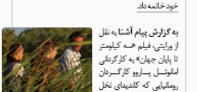
طی جشنواره فیلم سارو فیلم «سه کیلومتر تا پایان جهان» برنده جشنواره فیلم سارو شد.

«بیک» به مناسبت ایام فاطمه و موسیقی حسینی منتشر شده است. این آلبوم به هنرمندان موسیقی ایرانی تکیه بر عزت‌تعالی خود را به یاد می‌آورند.