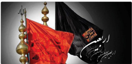
روشن فراری ما که گشودند که تا همیشه تاریخ، مصاح و هدایت و سفینه نجات ایام فرارگردان به حق است. تکریم