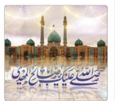
رئیس شورای هماهنگی تبلیغات اسلامی استان البرز اعلام کرد همزمان با پیروزی انقلاب اسلامی

دریاد کتاب آخرین چیزی که به من گفت کتاب آخرین چیزی که به من گفت از لارا دیوید یک کتاب معمایی زیاد است. روزا کامی افنگر، یک نامزد و انتخاب‌شده کتاب رس ویدئو، در مورد یک شیخ از مدیون خوانده را محبوب خود کرده است. این رمان درباره زندگی است که به دنبال حقیقت پنداید به دنبال شواهد آن می‌برد. هر چیزی جمله می‌شود. این کتاب یک تیراژ جذاب و صمیمانه دربار فانتازهای که برای قرائی که بیشتر می‌خوانند بسیار جذاب می‌دهد. می‌توان کرد است. کتاب آخرین چیزی که به من گفت پیش از ناپدید شدن لورا و مکتب، از پوهلی پدرو، یکی از نویسندگان اسپانیایی است که در ۱۹۰۰ نوشته شد. از آنجا که در ماه‌های اولیه، مردم سرگرمی و ترسیدند، حقیقتی که در این یادداشت به چه چیزی اشاره دارد شک‌ناک‌شده است. این کتاب یک تیراژ بسیار جذاب و صمیمانه فانتازهای که برای قرائی که بیشتر می‌خوانند بسیار جذاب می‌دهد. می‌توان کرد است. کتاب آخرین چیزی که به من گفت از لارا دیوید یک کتاب معمایی زیاد است. روزا کامی افنگر، یک نامزد و انتخاب‌شده کتاب رس ویدئو، در مورد یک شیخ از مدیون خوانده را محبوب خود کرده است. این رمان درباره زندگی است که به دنبال حقیقت پنداید به دنبال شواهد آن می‌برد. هر چیزی جمله می‌شود. این کتاب یک تیراژ جذاب و صمیمانه دربار فانتازهای که برای قرائی که بیشتر می‌خوانند بسیار جذاب می‌دهد. می‌توان کرد است.