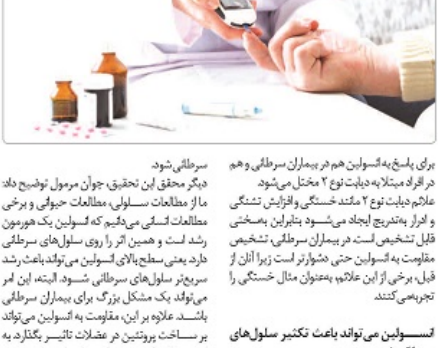
سرطانی‌ها دیگر محققان این تحقیق، جوان مرمول توضیح دادند.

سرطانی‌ها دیگر محققان این تحقیق، جوان مرمول توضیح دادند. ما از اطلاعات سلول‌ها، اطلاعات حیوانی و برخی اطلاعات انسانی می‌دانیم که فسیول یک مورمون رشد است و همین اثر را روی سلول‌های سرطانی دارد یعنی سطح بالای فسیول می‌تواند باعث رشد سریع سلول‌های سرطانی شود. البته این امر می‌تواند یک مشکل بزرگ برای بیماران سرطانی باشد. علاوه بر این، تزریق به انسان‌ها می‌تواند بر ساخت پروتئین در غشای تاثیر بگذارد و به این معنا که اثر این پروتئین به فسیول باید در همه توده عضلانی و قدرت خود را از دست می‌دهد و این مشکل بزرگی برای بسیاری از بیماران سرطانی است.