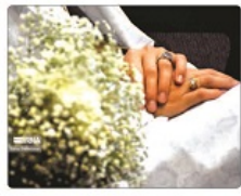
معاون رئیس جمهور در امور زنان و خانواده گفت: ترویج ازدواج آسان را از دستاویزها و ستارهای دهه شصتی‌ها آغاز کردیم.