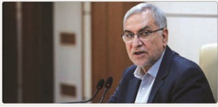
وزیر بهداشت هفتم از این مصوبه را آسان سازی و رایگان‌سازی بیمه‌های برای دهک‌های نخست و دوم اعلام کرد.

تجربه کاهش هزینه‌های درمانی مردم عنوان کرد. بنا بر اعلام وزیر بهداشت، میزان مشارکت همه دهک‌ها از قبل از این مصوبه، پراخت ۱۰ درصد حقیقی به معادل ۱۴۳ هزار تومان و میزان پراختی دهک پنج، ۲۰ درصد حقیقی به معنی ۲۸۷ هزار تومان بود که از این پس رایگان خواهد بود.