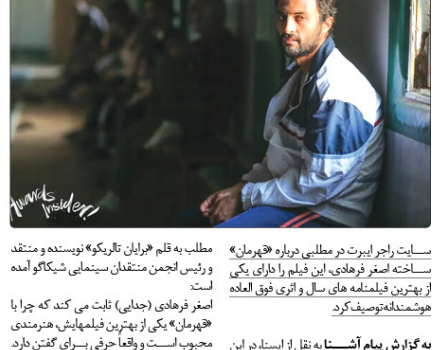
سایت راجر ایریت در مطلبی درباره «هرمان» ساخته اصغر فرهادی، این فیلم را دارای یکی از بهترین فیلمنامه‌های سال و اثری فوق العاده هوشمندانه توصیف کرد.

معون گردشگری البرز در قالب ویژه برنامه‌های تقدیر و تجلیل به عمل آمد و با اشاره به ظرفیت‌های گردشگری البرز اظهار کرد: با توجه به توسعه و ارتقای زیرساخت‌های گردشگری و بازدید یوسته از تأسیسات بندری، قلمی و تفریحی و رشد این صنعت فرایز جهانی از گزار خواهد بود. نیگرو با تأکید بر لزوم برگزاری دوره‌های آموزشی و صدور گواهی برای پرسنل شاغل در حوزه گردشگری تصریح کرد: به روزرسانی و آموزش مداوم از جمله مهم‌ترین بخش‌های این