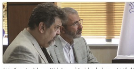
کیلی افزود: تسریع برای طی مراحل حقوقی مرتبط با تخصصی راه‌اندازی متروی کرج نیز در حرکت در ابریم.