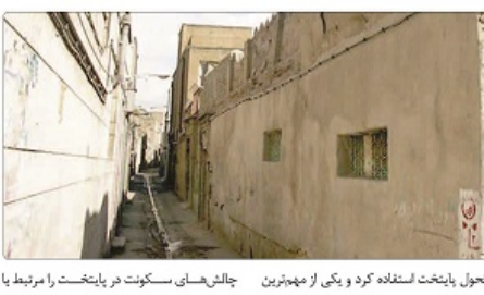
جانشین‌های سکونت در پایتخت را مرتبط با تحول پایتخت استفاده کرد و یکی از محورترین

سخنگوی شهرداری تهران از نوسازی هشت پهنه فرسوده تهران در آینده نزدیک خبر داد. شهرداری تهران اعلام کرده است که نوسازی هشت پهنه فرسوده تهران در آینده نزدیک انجام خواهد شد.