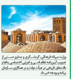
وزارت میراث فرهنگی، گردشگری و صنایع دستی از تصویب آیین‌نامه نظام فنی و اجرایی اختصاصی بناها و بافت‌های تاریخی در هیأت دولت و در همکاری سازمان برنامه و بودجه خبر داد.

به گزارش پیام آشنه، به نقل از ایستد وزارت میراث فرهنگی، گردشگری و صنایع دستی اعلام کرد که «آیین نامه نظام فنی و اجرایی اختصاصی بناها و بافت‌های تاریخی» در آبان ماه ۱۴۰۳ به تصویب هیأت دولت تصویب شد. تصویب این آیین‌نامه در دولت، زمینه‌ساز تدوین مقررات فنی اجرایی می‌تواند بود. وزیر راه و شهرسازی در گزارشی در این باره می‌گوید: «این آیین‌نامه اختصاصی‌شدن این نظام‌ها، اصول، برنامه‌ها و اسناد اختصاصی حسب نیازها و ضرورت‌های مرتبط بر جدول تعیین مشخصات و وضوح مالکیت آثار و عوامل جزیی در نظر گرفتن کمیسیون برین نظام فنی و تخصصی آثار ملی به طور ویژه و جدای از نظام فنی اجرایی موجود در کشور تدوین و عملیاتی شود. این نظام زمینه لازم را برای تنظیم کتب ملی و عوامل آرایندهای مرمت و توسعه کرمی و ترمیم‌های اجباری است».