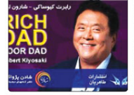
درباره کتاب پدر پولدار، پدر فقیر

کتاب صوتی پدر پولدار، پدر فقیر آنچه درنماتمن در مورد پول به فرزندان خود آموزش می دهد نویسنده:رابرت کیوساکی مترجم:محمدتقی خاندانه مترجم:حسن زری بای پوبل