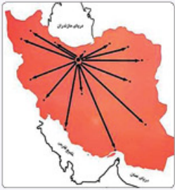
مناسب می‌تواند به چالش‌های حقوقی و مدیریتی منجر شود

ریسک چالش‌های حقوقی در مواقع اضطراری؛ تصمیمات استانداران ممکن است در شرایط اضطراری با مواردی که تعارض با قوانین ملی دارد، با مشکلات حقوقی مواجه شود.