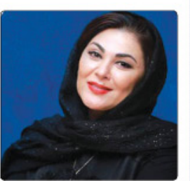
نخستین جشنواره بین‌المللی فیلم «آوی صلح» در جزیره قشم برگزار می‌شود.

نخورده... از جمله فیلم‌های وی هستند. جایزه استاد مدرن که سال ۱۹۹۵ ایجاد شد هر سال در جشنواره سلنتا باربارا برای تجلیل از چهره‌ای که با دستاوردهایش در صنعت سینما به غنی شدن فرهنگ کمک کرده، اهدا می‌شود. این جایزه از سال ۲۰۱۵ به افتخار مارتین منتقد و مجری قدیمی جشنواره بین‌المللی فیلم سلنتا باربارا، به نام جایزه استاد مدرن مانتین خولنده می‌شود. پیش از سندلر بازیگرانی چون آنجلینا جولی، جیمی لی کرتیس، نیکول کیدمن، خاویر باردم، رابرت داونی جونیور، دنزل واشنگتن، کیت بلانشت، جورج کلونی، کریستوفر پلامر و فیلمسازان تحسین‌شده‌ای مانند کریستوفر نولان، جیمز کامرون، کلینت ایستوود و پیتتر جکسون این جایزه را دریافت کرده‌اند. در این جشنواره بیش از ۵۰ برنده و نامزد جایزه اسکار از جمله زویی سالدانا، کلنم دومینگو، رالف فائیس، آدرین برودی، گای پیرس، مونیکا باربارو، سلنا گومز، آریانا گرانده، کلارنس مک‌کلین، مایکی مدیسون، جان مالکو، سیاستین استرن، فرانکا تورس، تیموتی شلامی و... تجلیل شدند. جشنواره بین‌المللی فیلم سلنتا باربارا از ۴ تا ۱۴ فوریه (تا ۱۵ تا ۲۵ تا ۲۶) به برگزار می‌شود. چهل و یکمین دوره این جشنواره شامل نمایش فیلم، جاسه پرسش و پاسخ با فیلمسازان، میزگردهای تخصصی و تجلیل از چهره‌های سرشناس خواهد بود.