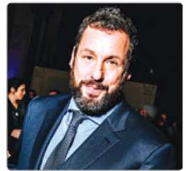
آدم سندلر از جشنواره فیلم سلنتا باربارا با جایزه استاد مدرن تجلیل می‌شود.

نخورده... از جمله فیلم‌های وی هستند. جایزه استاد مدرن که سال ۱۹۹۵ ایجاد شد هر سال در جشنواره سلنتا باربارا برای تجلیل از چهره‌ای که با دستاوردهایش در صنعت سینما به غنی شدن فرهنگ کمک کرده، اهدا می‌شود. این جایزه از سال ۲۰۱۵ به افتخار مارتین منتقد و مجری قدیمی جشنواره بین‌المللی فیلم سلنتا باربارا، به نام جایزه استاد مدرن مانتین خولنده می‌شود. پیش از سندلر بازیگرانی چون آنجلینا جولی، جیمی لی کرتیس، نیکول کیدمن، خاویر باردم، رابرت داونی جونیور، دنزل واشنگتن، کیت بلانشت، جورج کلونی، کریستوفر پلامر و فیلمسازان تحسین‌شده‌ای مانند کریستوفر نولان، جیمز کامرون، کلینت ایستوود و پیتتر جکسون این جایزه را دریافت کرده‌اند. در این جشنواره بیش از ۵۰ برنده و نامزد جایزه اسکار از جمله زویی سالدانا، کلنم دومینگو، رالف فائیس، آدرین برودی، گای پیرس، مونیکا باربارو، سلنا گومز، آریانا گرانده، کلارنس مک‌کلین، مایکی مدیسون، جان مالکو، سیاستین استرن، فرانکا تورس، تیموتی شلامی و... تجلیل شدند. جشنواره بین‌المللی فیلم سلنتا باربارا از ۴ تا ۱۴ فوریه (تا ۱۵ تا ۲۵ تا ۲۶) به برگزار می‌شود. چهل و یکمین دوره این جشنواره شامل نمایش فیلم، جاسه پرسش و پاسخ با فیلمسازان، میزگردهای تخصصی و تجلیل از چهره‌های سرشناس خواهد بود.