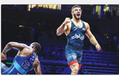
قاسم‌پور در حال جشن گرفتن مدال طلا.

قهرمان کشتی آزاد جهان پس از کسب این افتخار، مسدال طلای خود را به مردم کشورمان تقدیم کرد.