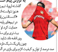
سردار آزمون در حال بازی فوتبال.

وی ادامه داد: شاید در در آلمان احساس راحتی نمی‌کند به علاوه او قبلی چون بازیکن شیک دارد که اکنون در سطح بسیار بالایی تیمی که آمدن او به درصد از توان و کیفیت لازم برای در آلمان بر خوراند است.