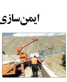
رئیس اداره ایمنی و ترافیک اداره کل راهبردی و حمل و نقل جلجلی از ایمن‌سازی ۱۰ نقطه پر تصادف با رویکرد ایمن‌سازی کاربران اتوبوس‌های راه‌های استان خبر داد.

به گزارش پیام آشتنا، سرهنگ محمد ناریبگی در تشریح این خبر گفت: در پی ارجاع یک فقره پرونده تصاحب غیرقانونی به املاک توسط یک باند کلاهبرداری سازمان یافته در منطقه چهارمحال کرج، بررسی موضوع در دستور کار اداره میرزه با جعل و کلاهبرداری پلیس آگاهی قرار گرفت. وی افزود: بررسی‌های اولیه معلوم حالی از این باند اعضای بلد یک سازمان یافته کلاهبرداری با شناسایی املاک بلاصاحب اقدام به جعل سند آنها