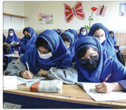
مدیرکل آموزش و پرورش البرز گفت: سفر رئیس جمهور برای آموزش و پرورش این استان ۴۷۱ میلیارد تومان در قالب ۶ مصوبه به ارمغان آورد.

خاطرنتشان کرد: اختصاص مبلغ ۴۰۰ میلیارد تومان برای احداث و تکمیل واحدهای آموزشی نیمه تمام احداثی خیرین (مبلغ ۲۵۰ میلیارد تومان از اعتبارات سازمان توسوی مدارس ۱۵۰ و میلیارد تومان توسط سازمان برنامه و بودجه کشور) در سالهای ۱۴۰۲ تا ۱۴۰۴ و مبلغ ۶۰۰ میلیارد تومان از محل کمک خیرین استان البرز تاکنون ۲۰ میلیارد تومان و آموزش و پرورش البرز اختصاصی ۱۲ میلیارد تومان برای تکمیل استخر شنا دانش آموزی شهید آخوندی کرج توسط سازمان برنامه و بودجه کشور در سال ۱۴۰۱ را از دیگر مصوبه های این سفر ذکر کرد. حجرتست تصریح کرد: برای تأمین سیستمهای گرمایشی و سرمایشی مدارس استان توسط سازمان توسوی، توسعه و تجهیز مدارس نیز در سال ۱۴۰۱ مبلغ ۲۰ میلیارد تومان اختصاص می یابد. وی بیان کرد: همچنین پنج میلیارد تومان برای تکمیل درگاهتخصصی آموزش و پرورش استان توسط سازمان برنامه و بودجه کشور در سال ۱۴۰۱ اختصاص خواهد یافت و یه و شورشسرای نسبت به احداث مدارس شهرک ابریشمشهر جدید هشتگرد و اعلاندشت مربوط به مسکن مهر در سالهای ۱۴۰۱ و ۱۴۰۲ اقدام خواهد کرد. مدیرکل آموزش و پرورش البرز اظهار کرد: مبلغ ۲۴ میلیارد تومان برای تکمیل ۱۰ واحد آموزشی از محل اعتبارات استان