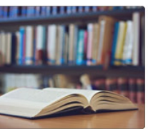
کتابخانه‌های البرز، مرکز فرهنگی و تفریحی نوجوانان