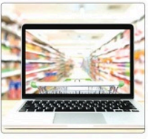
تصویر از صفحه خرید کالا در فروشگاه اینترنتی.

برای خرید کالا بزرگ الکترونیک امکان خرید آنلاین فراهم شده است. معاون وزیر تعاون، کار و رفاه اجتماعی از فراهم شدن امکان خرید برخط مردم در طرح کالا بزرگ الکترونیک خبر داد.