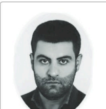
Portrait of a man, likely a politician or official.

به گزارش پیام آشنما، ایالت سیده ابراهیم رژیسی در جلسه شورای عالی محیط زیست اصل پنجاهم قانون اساسی، سیاستهای کلی حفاظت محیط زیست ایالتی از سوی مقام معظم رهبری، بایه کلام مردم انقلاب اسلامی و مسند تحول دولت مردمی را با سند مهم و بالادستی در حوزه محیط زیست تشریح و در مورد همه استانها بالادستی کشور تاکید شده که در توسعه فرغ فرغ حفظ محیط زیست است. اما این به معنی آن نیست که به پیافه حفاظت از محیط زیست اجازه توسعه به صنایع و اقتصاد کشور بدهیم.