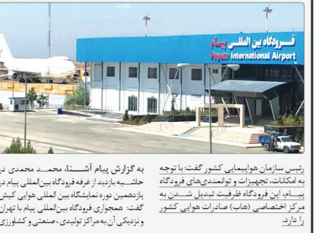
نوردهای ایالتی Payam International Airport

رژیس سازمان هواپیمایی کشور گفت: با توجه به امکانات، تجهیزات و توانمندی های فرودگاه با حسنیه، این فرودگاه ظرفیت تبدیل شدن به مرکز اختصاصی (هاب) صادرات هوایی کشور را دارد.