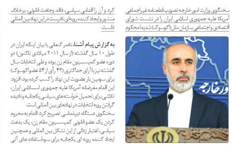
Portrait of a man, likely a politician or official.

تاکید کرد: با ساز و کاری که برای بازار صادرات و خرید و فروش نفتی شده است، زمینه صادرات خودروهای چینی و هندی فراهم شده است. نایب رئیس کمیسیون عمران مجلس شورای اسلامی، تاکید کرد: با ساز و کاری که برای بازار صادرات و خرید و فروش نفتی شده است، زمینه صادرات خودروهای چینی و هندی فراهم شده است.