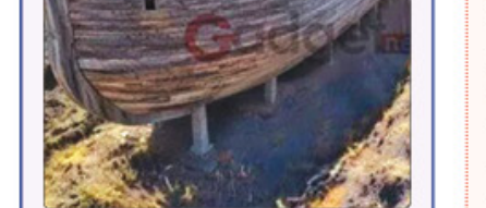
معمای باستانی کوه آراتا کوه آراتا مدت‌هاست که به‌عنوان مکان احتمالی فرود کشتی نوح پس از طوفان بزرگ شناخته می‌شود. این گروه از باستان‌شناسان می‌گویند شواهد آن‌ها می‌تواند این باور قدیمی را ثابت کند. اما تا زمان تأیید نهایی توسط منابع مستقل، این کشف همچنان یک معمای جذاب علمی و تاریخی باقی خواهد ماند.

تردید جامعه علمی: شواهد کافی نیست با این حال، جامعه علمی همچنان با دیدن تردید به این موضوع نگاه می‌کند. بسیاری از کارشناسان معتقدند که این یافته‌ها ممکن است بقایای یک کشتی باستانی دیگر یا حتی یک سازه طبیعی باشند. آن‌ها خواستار بررسی‌های دقیق‌تر و آزمایش‌های تاریخ‌سنجی مستقل هستند. این ادعاها همواره جنجالی بوده‌اند و نیازمند شواهد بسیار قوی هستند.