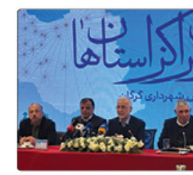
وزیر کشور با اشاره به ضرورت تلاش همگانی برای برگزاری پرشور انتخابات تأکید کرد با وجود نیاز به مشارکت پرشور، هرگونه کلتگ‌زنی بیهوش‌نیتونه و یقینی و افتتاح زودرس پروژه‌ها در نزدیکی انتخابات شوراها ممنوع است و پیگیری خواهد شد.

بالای ۵۰۰ هزار نفر، انتخابات تناسی است که احزاب به نسبت از هر کسب می‌کنند. وی ادامه داد: انتخابات شورا در تهران تناسی است و در دوره بعدی شهرهای بالای ۵۰۰ هزار نفر تناسی خواهد شد. به این معنا که شکل‌ها و احزاب به نسبت آرای که آورده‌اند کرسی‌ها را به خود اختصاص می‌دهند. برای مثال اگر حزبی ۴۰ درصد رای آورده باشد، ۴۰ درصد کرسی‌ها را به خود اختصاص می‌دهد. وزیر کشور گفت: سخن برخی می‌تواند به بیشترین رای را می‌آورد نتواند ائتلاف ایجاد کند و بقیه احزاب با ۶۰ درصد رای با هم ائتلاف کنند و آن‌ها شهردار را انتخاب کنند. اکثریت را به دست می‌گیرند این سبب افزایش رقابت می‌شود. حتی سخن برخی می‌تواند به لیست شهردار خود را انتخاب کنند که این هم موثر در مشارکت خواهد بود. به گفته مومنی تغییر دیگر این که انتخابات شوراها به صورت تکی و معجزان برگزار می‌شود و انتخابات دیگری به صورت آن خواهد بود. وی نقش شهرداران را در رضابندندی مردم، رضای سرمایه‌ای‌های و بهبود کیفیت زندگی می‌بیند. وی گفت: شهردارهای بهترین‌ترین آثار را در زندگی روزمره مردم و رفح مشکلات دارند و در این میان، نقش ۳۱ کلان‌شهر و مرکز استان، به دلیل تمرکز جمعیت این نقش تعیین‌کننده‌تر است.