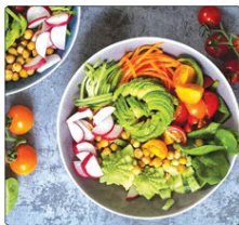
یک مطالعه جدید نشان می‌دهد که تعداد بی‌سلفای از مردم به رژیم غذایی غذایی روی می‌آورد تا از فواید سلامتی آن بهره‌مند شود. اما این روند ممکن است به صورت استخوان‌ناهم نشود.