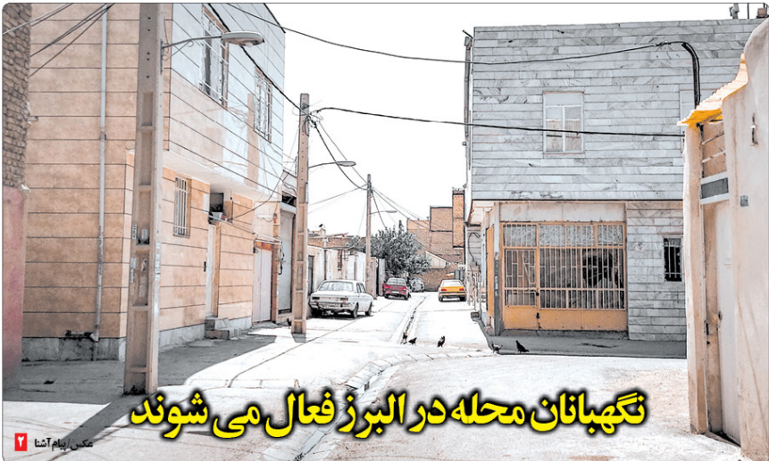
نگهبانان محله در البرز فعال می‌شوند

فراخوان اولین نمایشگاه نقاشان طبیعت‌گرای البرز