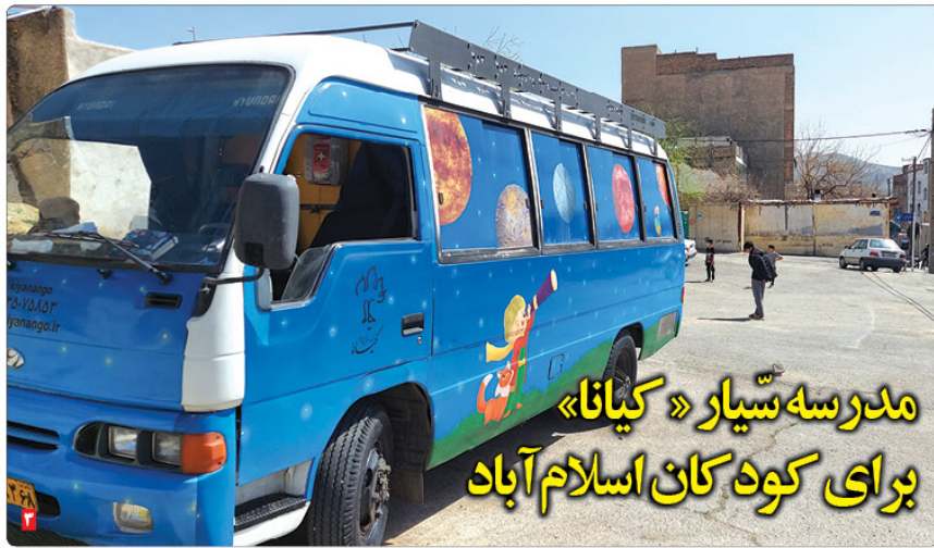
مدرسه سیار «کیانا» برای کودکان اسلام آباد

رسانه چه خبر جشنواره ابوذر به دنبال توانمندسازی رسانه ها است