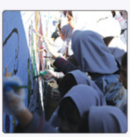
نقاشی دیواری مشارکتی، مسیر خود را با تمرکز بر کیفیت اثر گذاری ادامه می‌دهد.

مسئله آب ارتباط بگیرند، در آینده شهروندان، مدیران و تصمیم‌گیری دفعه‌مست خواهند بود. او تأکید کرد که هدف پوش، صرفاً برگزاری یک کارگاه یا برنامه کوتاه نیست، بلکه ایجاد نگرانی آگاهانه و مسئولیت‌پذیری در نسل آینده است. نسلی که می‌تواند پیام آب را به خانواده و اطراف خود منتقل کند. پوش نجات قطره‌ها از سال ۱۴۰۱ تاکنون به همت پایگاه خبری هزار و یک شهر، با همکاری شرکت رنگ نیون و شرکت آب منطقه‌ای البرز در مدرسه مختلف استان البرز برگزار شده و با تکیه بر آموزش تعاملی، گفت‌وگو با کودکان و