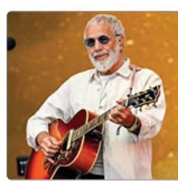
یوسف اسلام مجبور شد تور معرفی کتاب خود در سراسر آمریکا را لغو کند.

اگر وزیر بعداً تأیید شود هم می‌تواند تور آمریکای شمالی را برگزار کند، اما هر تاریخ جدید به دلیل برنامه‌های دیگر این تور، مدتی طول خواهد کشید. اسلام ۷۷ ساله پیش از این علیه اقدامات اسرائیل در غزه بارها صحبت کرده اما درباره دلیل تأخیر در برای وی هنوز به شکل رسمی اعلام نشده است. این هنرمند در ماه اگوست در ۳ بست گذاشت و نوشت: «چه کسی ما را رهبری می‌کند... و کجا؟» و «عربان به اصطلاح «جهان متمن» در حال ایجاد جهانی به شدت نامتعادل هستند، جایی که قوانین بین‌المللی به نفع و پیشرفت کشورهای نخبه‌گرا