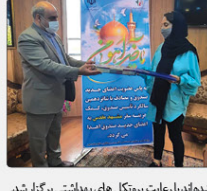
شده‌اند با رعایت پروتکل های بهداشتی هر گزار شد.