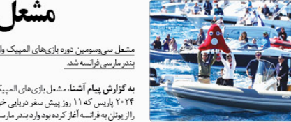
مشعل سی‌وسومین دوره بازی‌های المپیک ولد بندر ماریه فرانسه شد.

دیدارک فدراسیون جهانی با اشاره به برگزاری