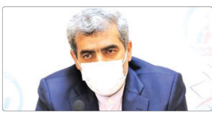
وی سال ۹۹ را سال بسیار سختی برای کادر بهداشت و درمان کشور عنوان کرد و یادآور شد: برخی پرستاران ماها از خلوده خود دور بودند و جرات اینکه به خانواده خود نزدیک شوند

وی بیان کرد پیشگیری نقش مهمی در چرخه گسترش و انتقال ویروس کرونا دارد لذا توجه به توصیه های فعالان حوزه سلامت در این شرایط کرونایی بسیار الزامی است.