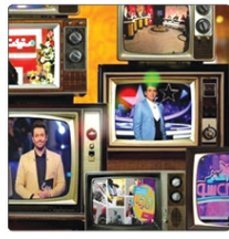
این روزها بازیگران در عرصه اجراء هنری‌ها به مجریان کاربلد توکلند و متأسفانه کاربلد است که بعضاً خود مجریان این کارها را دارند.

به گزارش پیام آشتا، فهرست کامل فیلم‌های حاضر در چهل و پنجمین جشنواره فیلم سائو پائولو اعلام شد و بر اساس این فیلم «پهران» ساخته