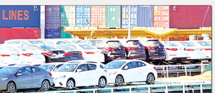
مذاکرات شلن را با شرکت‌های خودرو ساز دنیا آغاز کردند. کالیباف اضافه داد، از ابتدای مهرماه امکان واردات