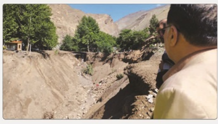
مجموعه‌ای از سیلاب‌های جاری در جاده چالوس در شب گذشته.