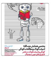
پنجشنبه همایش مسالانه

میدرکل آموزش و پرورش... این کتاب به ما می‌گوید که چگونه می‌توانیم از آموزش و پرورش برای اهداف خود استفاده کنیم. این کتاب به ما می‌گوید که چگونه می‌توانیم از آموزش و پرورش برای اهداف خود استفاده کنیم.