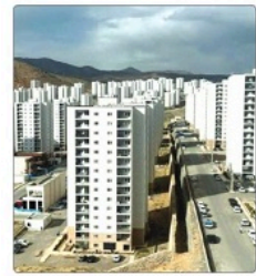
مدیرعامل سازمان ملی زمین و مسکن از آماده‌سازی حدود ۵۰ هزار هکتار از اراضی سازمان ملی زمین و مسکن در نقاط شهری و شهرک‌ها به استناد پیش

روند شتابان پیشرفت‌های فناوری به همراه سوق تدریجی جهان به سمت اقتصاد پایداری، پدیدار شدن شرکت‌ها را به توسعه رویکردهای مدنی‌زیست‌محیطی مختلفی گشوده است. در نتیجه، بسیاری از شرکت‌ها وعده داده‌اند که در برنامه‌ها و فعالیت‌های خود، محیط‌زیست را بیشتر لحاظ کنند. کسب‌وکارهای خانوادگی به عنوان محبوب‌ترین و فراگیرترین نوع کسب‌وکارها نیز از این قاعده مستثنی نبودند. آنجا که رویکردهای مدیریت زیست‌محیطی برای مکان‌های کسب‌وکارهای خانوادگی که با اهداف و پیچیدگی‌های چندان کم‌تر مواجهند، چالش‌های خاصی خود را به همراه داشته است. سوال اینجاست که آیا ساختار سازمانی چنین کسب‌وکارهایی به عملکرد زیست‌محیطی آنها توان و گنجش به چالش‌ها می‌گردد و اگر پاسخ مثبت است، میزان و شیوه‌نگاری آن چگونه است؟