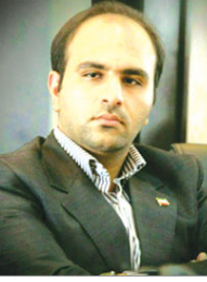
رئیس سازمان امداد و نجات کشور

در آیین محرم در کهریزک، مراسم سیاهپوشی برگزار شد. این مراسم به منظور تکریم ائمه اطهار و عزاداری برگزار می‌شود. همچنین در این مراسم، مراسم عزاداری و تکریم ائمه اطهار برگزار می‌شود.