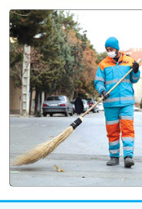
فرهنگ پاکبانی و پشتیبانی خدمات نظافتی این رویداد، به معنای بازسازی هویت شهری است که شامل آموزش، توسعه مهارت‌ها، رفاه و امنیت کارکنان می‌شود.

آقایوس‌ها، به معنای بازسازی هویت شهری است که شامل آموزش، توسعه مهارت‌ها، رفاه و امنیت کارکنان می‌شود. در شهرسازی معاصر، بازتعریف نماد در شهرسازی، به معنای بازسازی هویت شهری است که شامل آموزش، توسعه مهارت‌ها، رفاه و امنیت کارکنان می‌شود.