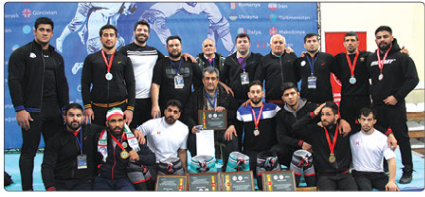
تیم کشتی سنتی ایران در رقابت های جهانی «شلوار گورش» ترکیه با کسب ۲ امتیاز طلا، ۳ نقره و یک برنز، نایب قهرمان شد.

به گزارش پیام آشنا، یکصد و هفتمین دوره رقابت های جهانی کشتی «شلوار گورش» ترکیه برگزار شد و تیم ایران با کسب ۲ طلا، ۳ نقره و یک مدال برنز پس از تیم میزبان بعنوان نایب قهرمانی دست یافت.