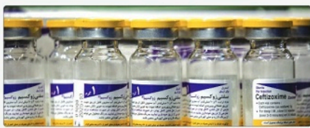
رئیس سازمان غذا و دارو با بیان اینکه تگرفی برقراره تامین داروی بیماران صعب‌العلاج در داروخانه‌های منتخب اعلام کرد.

ایم تعطیلات را مشخص کنند به طور معمول داروخانه‌ها در ایام تعطیلات فعال هستند و اگر داروخانه تعطیل باشد باید به داروخانه دیگر به‌عنوان جایگزین معرفی کنند.