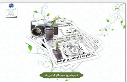
روز خبرنگار را به فراصلان این عرصه خطیری و سنگربانان عرصه حقیقت طلبی و آگاهی بخشی تبریک گفته.