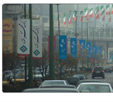
مدیر کل هوشناسی استان البرز اعلام کرد که با توجه یاداری جوی تا پایان هفته جاری شاهد افزایش آلودگی هوادر استان خواهیم بود.

وی گفت: عمده تخلفات این واحدهای صنعتی گرانروشنی، عدم درج قیمت، عدم رعایت