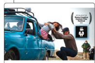
به گزارش پیام آشنا به نقل از روابط عمومی فیلم کوتاه منفی ۳۶۲۵، به تهیه‌کنندگی و کارگردانی حسین بلقیان اولین حضور بین‌المللی خود در جشنواره بین‌المللی روما Creative Contest در رم ایتالیا خواهد داشت.

فیلم کوتاه «منفی ۳۶۲۵» به تهیه‌کنندگی و کارگردانی حسین بلقیان در جشنواره ایتالیایی حضور بیامی کند.