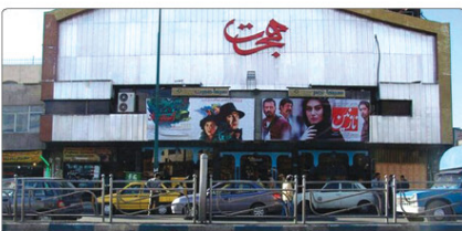
سینماهای کشور است، گفت‌اخصاص زمین برای

شورای چهارم پیگیری و مصوب شد. وی توضیح داد: در همان دوران زمین عمومی نیز معرفی شد و حوزه هنری نقشه و طرح پیشنهادی برای ساخت پردیس سینمایی را هم ارائه داد ولی متأسفانه هنوز روند رد شورای پنجم متوقف شده. مهملی اضافه کرد: شورای پنجم اقدام به حفظ سینما در بافت قدیمی کرج نداشتند و می‌خواستند این مجموعه را برای بازسازی رونق گذشته خود را بازبیاورند ولی این اتفاق نرفت و شرایط با بلاتکلیف نگه داشتند.