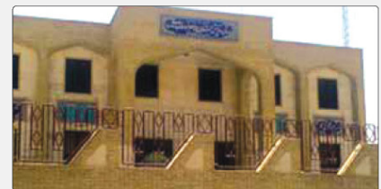
۱۲ سال در این پویش مورد هدف است گفت: این نقاشی‌ها در سایت forBajoor.ir برای ترویج فرهنگ مدرسه‌سازی مورد استفاده قرار

رئیس جامعه خیرین مدرسه‌ساز کشور گفت: پویش ملی «به رنگ مدرسه» در راستای طرح تحولی «چرخه آجر و آهنگ ترغیب هر چه بیشتر مردم به امر مدرسه‌سازی در کشور از سوی جامعه خیرین مدرسه‌ساز کشور از ۱۵ شهریور اسما آغاز