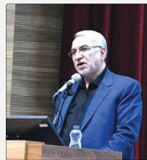
وزیر بهداشت، درمان و آموزش پزشکی در تکیه و تکمیل ساخت چهار مرکز درمانی و اورژانس در نقاط صفر مرزی

سرمد فضایی با بیان اینکه عدالت آموزشی یعنی دسترسی برابر تمام دانش‌آموزان به خدمات آموزشی، استفاده از فرسودگی مدارس و تجهیزاتی که فرستاده‌های آموزشی از آنها استفاده می‌کنند، مستحکم و با اولویت بوده به آن توجه ویژه‌تری در برنامه هفتم توسعه چند محور اساسی را دربردارد. سرمد فضایی در ادامه به عنوان مدیر عامل شرکت توسعه و تجهیز مدارس گفت: آموزش یعنی دسترسی برابر به امکانات آموزشی و خدمات آموزشی. استفاده از فرسودگی مدارس و تجهیزاتی که فرستاده‌های آموزشی از آنها استفاده می‌کنند، مستحکم و با اولویت بوده به آن توجه ویژه‌تری در برنامه هفتم توسعه چند محور اساسی را دربردارد. سرمد فضایی در ادامه به عنوان مدیر عامل شرکت توسعه و تجهیز مدارس گفت: آموزش یعنی دسترسی برابر به امکانات آموزشی و خدمات آموزشی. استفاده از فرسودگی مدارس و تجهیزاتی که فرستاده‌های آموزشی از آنها استفاده می‌کنند، مستحکم و با اولویت بوده به آن توجه ویژه‌تری در برنامه هفتم توسعه چند محور اساسی را دربردارد.