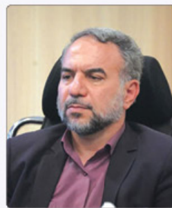
عضو شورای اسلامی شهر کرج به معرفی پروژه‌های درآمدزایی اولویت‌دار شهرداری کرج: از پارک‌گرد تا پل کرج و طرح‌های تفریحی بلندمدت اشاره کرد و گفت: کرج این ظرفیت را

عضو شورای اسلامی شهر کرج پروژه «پارک‌گرد کرج» را یکی از پروژه‌های آماده بهره‌برداری معرفی کرد و افزود: این مجموعه می‌تواند میزبان رویدادهای شهری، غرفه‌های فرهنگی و خدماتی، اجاره دوچرخه و واحدهای پذیرایی باشد و با