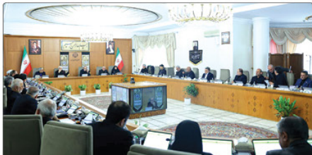
سخنگوی آسیب دیده از حملات تجاوزکارانه رژیم صهیونیستی هزینه کند»

پشتیبانی مرکز استان نیاز دارد. وی با اشاره به اهمیت نیروی انسانی متخصص و تجهیزاتی کارآمد خاطرنشان کرد، تهدید تنها محدود به جنگ نیست، زلزله، سیل و دیگر بلایای طبیعی نیز توانایی اختلال در عملکرد شهر را دارند. آمادگی در همه سطوح بحران ضرورت است.