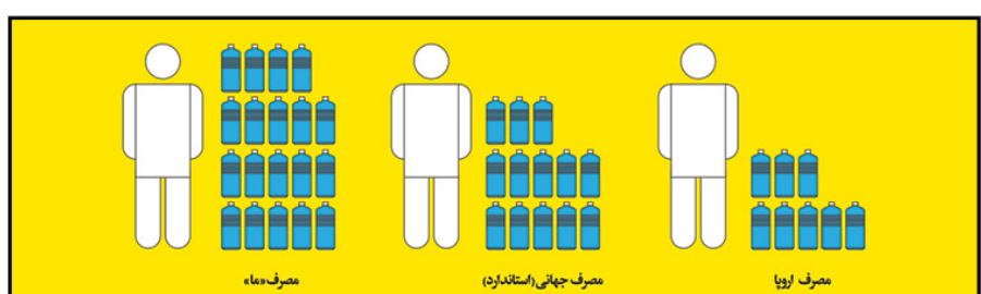
مصرف جهانی (استاندارد) مصرف اروپا مصرف همه

تغییر سیستم‌های انرژی از سوخت‌های فسیلی به انرژی‌های تجدیدپذیر می‌تواند خورشیدی یا بادی، انتشار گازهای گلخانه‌ای که باعث تغییرات اقلیمی می‌شوند را کاهش می‌دهد. در حالی که تعداد فرآیندهای از کشورهای منتهی می‌شوند تا سال ۲۰۵۰ میزان انتشار گازهای گلخانه‌ای را به صفر برسانند، انتشار گازهای گلخانه‌ای باید تا سال ۲۰۲۰ به نصف کاهش یابد تا گرمایش کمتر از ۱/۵ درجه سانتیگراد شود.