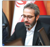
به گزارش پیام آشنانه، فاطمه مهاجری* سخنگوی دولت روز چهارشنبه ۱۱ خرداد ۱۴۰۲ با

با وجود اهمیت حیاتی سیاستگذاری در حوزه‌های مختلف علوم و فنون و ضرورت اجتناب از پیش‌امی و لزوم توجه به مفاهیم سیاست‌های کلان (توزیع آبراهه‌ها) در میان طیف‌های مختلف مدیران و سیاستمداران همچون مهندسان است.