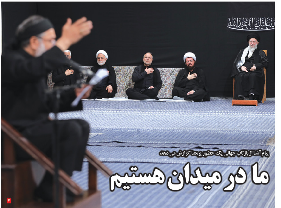
پیام آشنا از بازتاب جهانی یک حضور پرمعنا گزارش می دهد