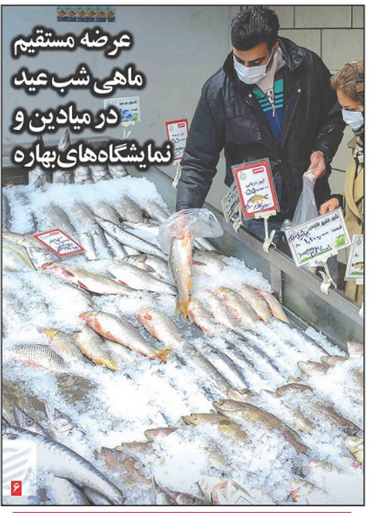
عرضه مستقیم ماهی شب عید در میادین و نمایشگاه‌های بهاره