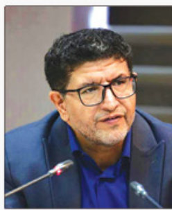
بین دستگاهها و ارتقای محتوایی برنامه‌های نمایشگاه قرآن و عترت البرز است تا این رویداد به شکل شایسته و اثرگذار برگزار شود.

قرآنی، نهادهای فرهنگی مردمی و سایر دستگاههای اجرایی استان افزود: پیشتر فراخوان ارائه طرح‌ها اعلام شده و بر همین اساس، متقاضیان تا ۲۰ بهمن‌ماه مهلت دارند ایده‌ها و برنامه‌های پیشنهادی خود را برای بررسی و اجرا به کمیته محتوایی نمایشگاه ارائه دهند. شرفی تا یکم اردیبهشت هدف از این رویداد، تقویت نقش آفرینی مجموعه‌های مردمی، هم‌اگرایی