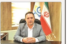
رئیس کل دادگستری وکلای استان البرز گفت: حال عمومی تمام دانشجویان دچار مسمومیت مساعد و روپه‌بودی کامل هستند.

رئیس کل دادگستری استان البرز با تبیین مصادیق تشخیصی درست و صحیح موضوع «تفاهه کرد» در فرآیند رسیدگی قضایی، ایندلی‌ترین و در عین حال سخت‌ترین مرحله، هرصاحه تشخیصی موضوع و «واقع» است. اگر تشخیص موضوع به درستی انجام شود، موضوع تطبیق موضوع با حکم و صدور حکم به درستی انجام می‌دهد.