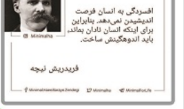
افسردگی به انسان فرصت اندیشیدن می‌دهد. باورهای برای اینکه انسان نادان باعناد باید اندوخته‌اش ساخت.

معاون حقوقی و مجلس وزیر آموزش و پرورش از لحاظ شغل تفریق ویژه ستوایی برای پذیرش معلمان غیر رسمی در آزمون استخدامی به ازای هر سال خدمت و زمان وقت (۲۶ ساعت در هر هفته) معلمان غیر رسمی فریب ۱.۱ و به ازای هر سال یک دهم